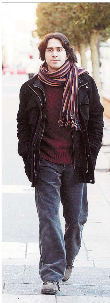
'La vida en inglés' es su primer libro.

Publicado dentro de la colección Nistagmus, el primer libro de relatos del tres veces Premio Letras Jóvenes de Castilla y León ve-